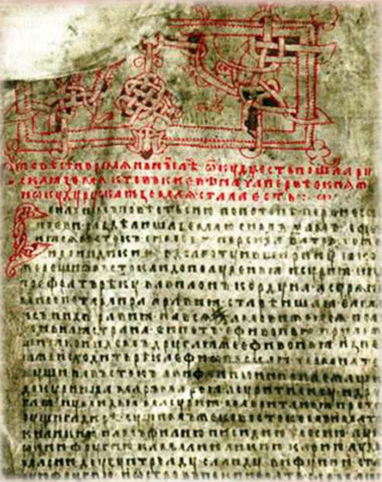
Страница Ипатьевской летописи

Летопись — особый вид исторического повествования по годам (летам). Русское летописание возникло в XI в. и продолжалось вплоть до XVII в.