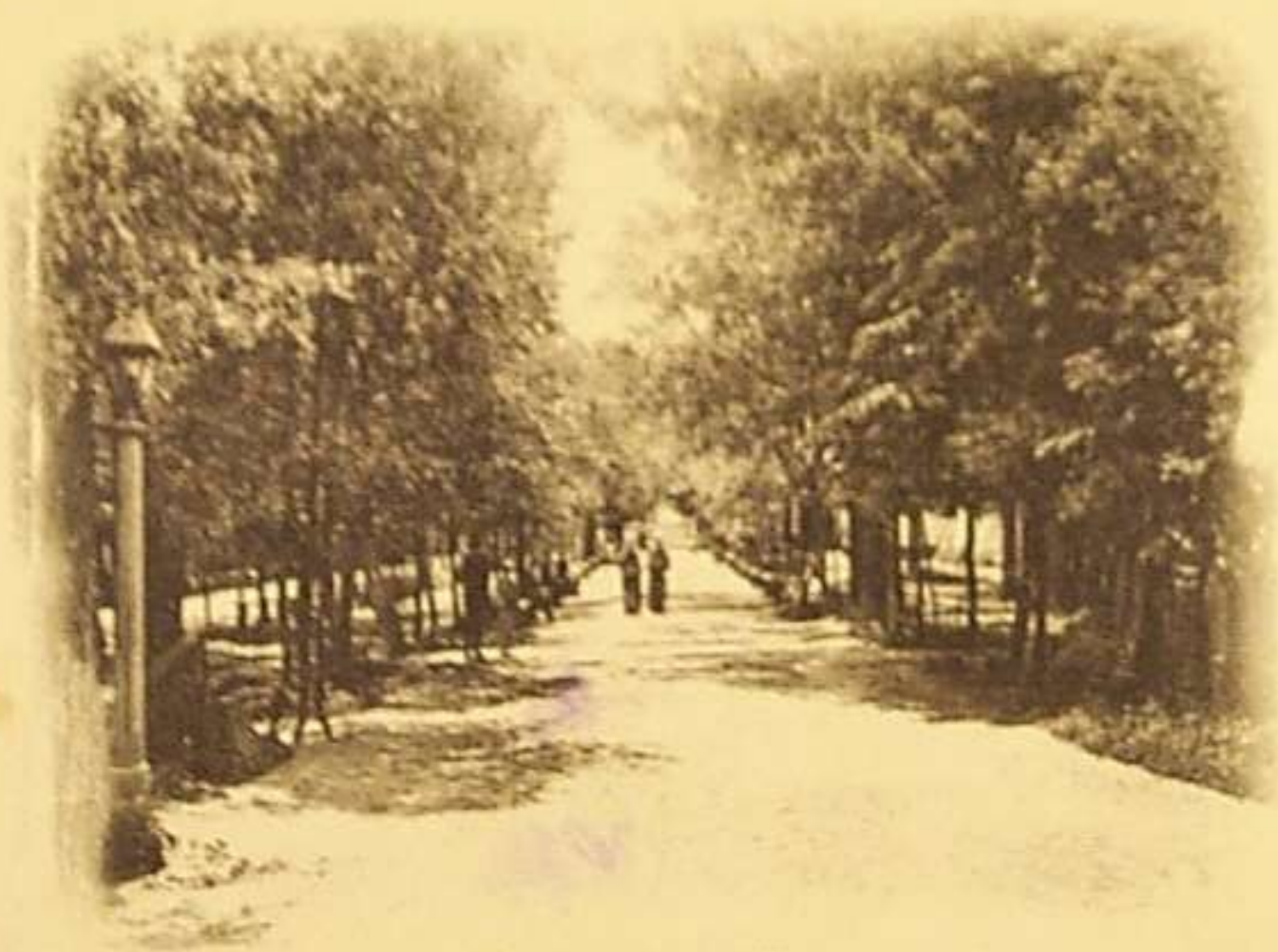
ГОРОДСКОЙ КРЕМЛЕВСКОЙ САДЪ, ТУЛА.