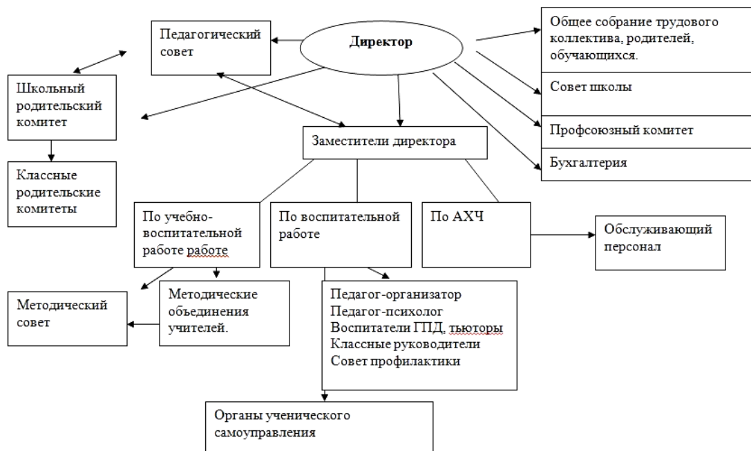
Схема системы управления образовательным учреждением